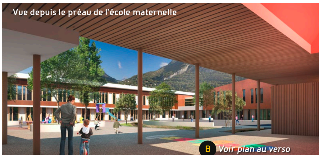
Vue depuis le préau de l'école maternelle

* Une garde d'enfants (3 ans et plus) est organisée. Pour les inscriptions, contactez le 04 76 48 66 25 (Audrey) ou secteurs1-3.education@grenoble.fr