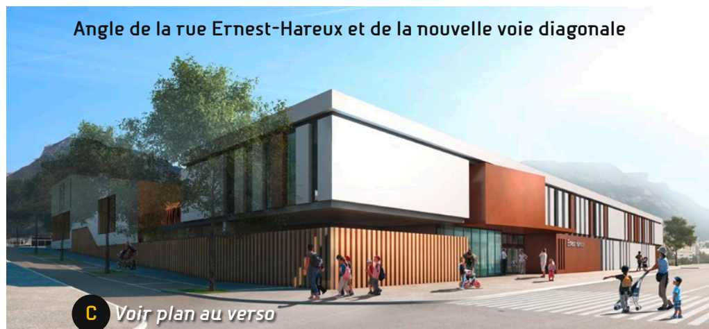
Angle de la rue Ernest-Hareux et de la nouvelle voie diagonale